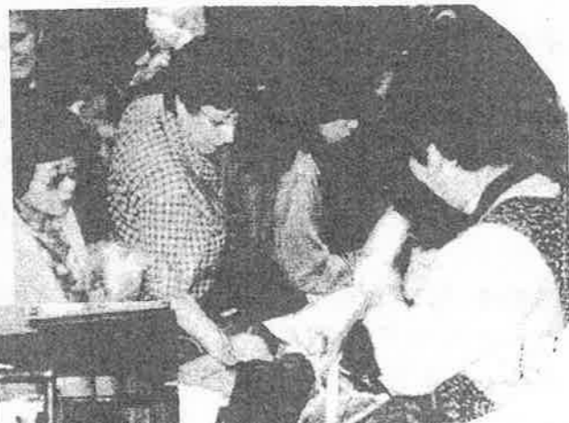
殺到する 帯売りの場 ワゴン