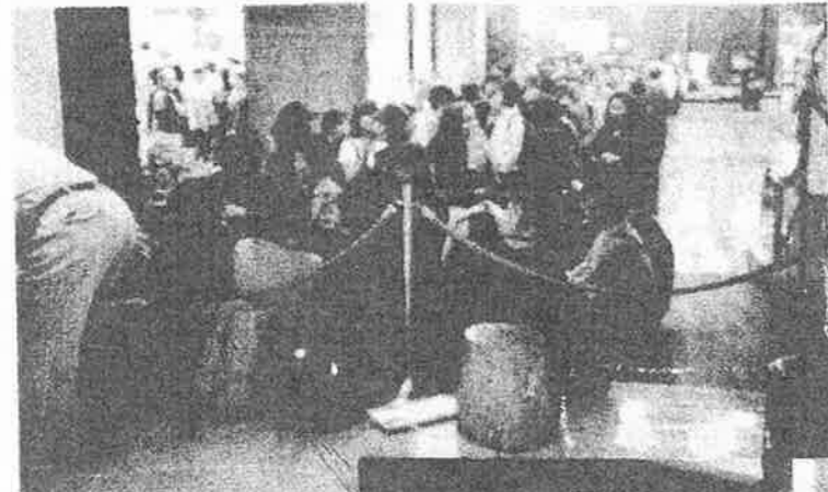
開場1時間前 県民センター 正面入り口外まで 続きました。

今回も大勢のボランティアの方々(延べ人数609名)の協力で余裕を持って準備も進み無事開催することが出来ました。当日のフェア来場者も約900名と大盛況で、今回は特に開場一時間前の9:00には会場となっている かながわ県民センターの外まで行列ができ人員整理に追われました。最近の売れ筋商品の中に中古の足袋があります。使い道は、漂白や染め直ししてそのまま履いたりコハゼを袋物の金具に使うそうです。アイデア次第でまだまだ使える物がいっぱいです!