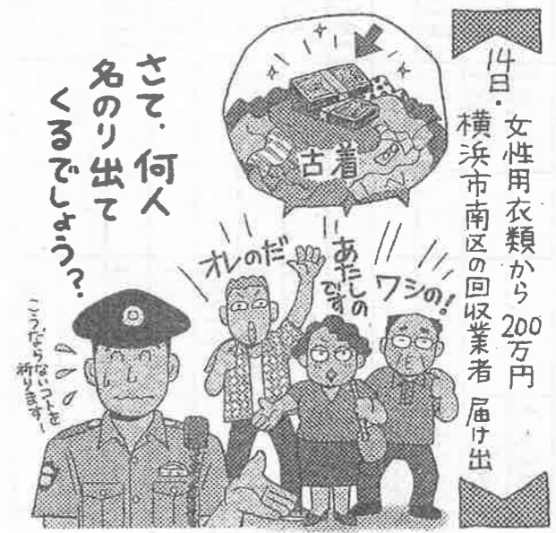
イラスト・瀬々倉 匠美子

「私です」本物の持ち主判明。知人が無盗を知っていたため、十月二十一日、近くの交番に届け出た。女性が同様に現金を隠した帯や、縫い合わせる際に使った糸、見つかった札束と同じ日付が記された帯封の札束を証拠として提示したことから、女性が持ち主であると判明した。十日までに同署に寄せられた届け出は十七件。一癖呆症の養母がお金を隠す癖がある)などといった内容で、中には愛知県からの届け出もあったという。(北村 陽子)